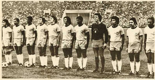
Gelingt dem Weltmeister der vierte Streich? Von links erkennen wir Clodoaldo, Luis Pereira, Marco Antonio, Moises, Letivina, Valdomiro, Ze Maria, Vendel, Jairzinho, Rivelino und Paulo Cesar. Unten: Konditionsarbeit wurde in der Vorbereitung großgeschrieben: Jairzinho führt Sprungübungen durch, während Paulo Cesar die Anweisung erteilt.

kapitalistischer Industrie-Arbeitskraft mit mittlerem Entwicklungs-niveau. Obwohl alle wichtigen Industrien und gewaltige Rohstoffressourcen vorhanden sind, ist die regional ungleichmäßig entwickelte Wirtschaft durch einseitige Ausrichtung auf ausländische Profitinteressen erblich deformiert. Wichtige Exportprodukte sind neben Kaffee und Baumwolle vor allem Holz, Eisen und Stahl.