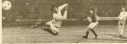
Das war Maßarbeit! Unahbar schlägt der von Streich mit Effet aufs Tor gezogene Ball hinter dem sich wertenden Schlussmann Clemence ein. Watson scheint das Unheil zu ahnen.